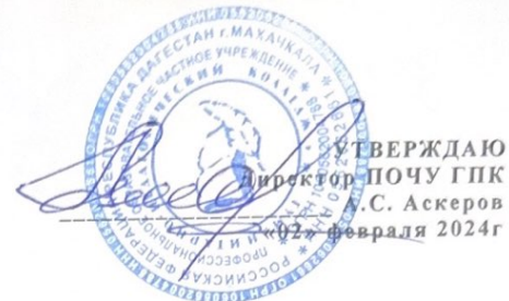
ГРАФИК передача промежуточной аттестации за 1 семестр 2023-24 уч.г. (с 12.02.24 по 16.02.24) 39.02.01 Социальная работа. Очное отделение