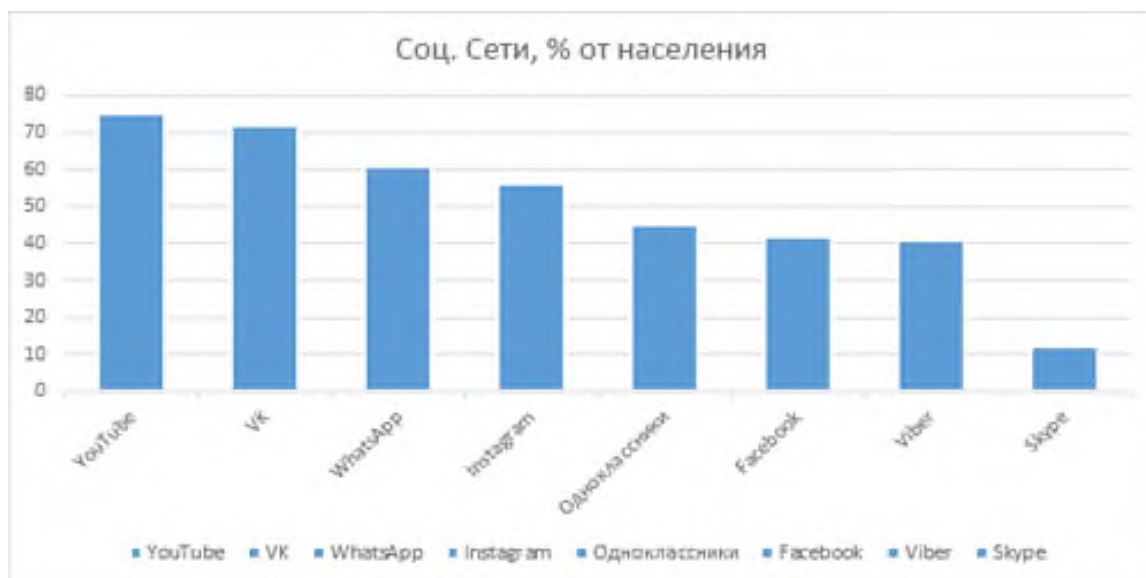
Рисунок 4.1 – Популярность социальных сетей в России за 2019 год