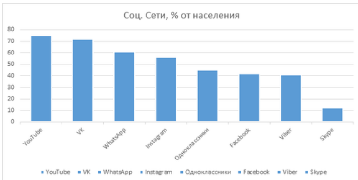
Рисунок 4.1 – Популярность социальных сетей в России за 2019 год